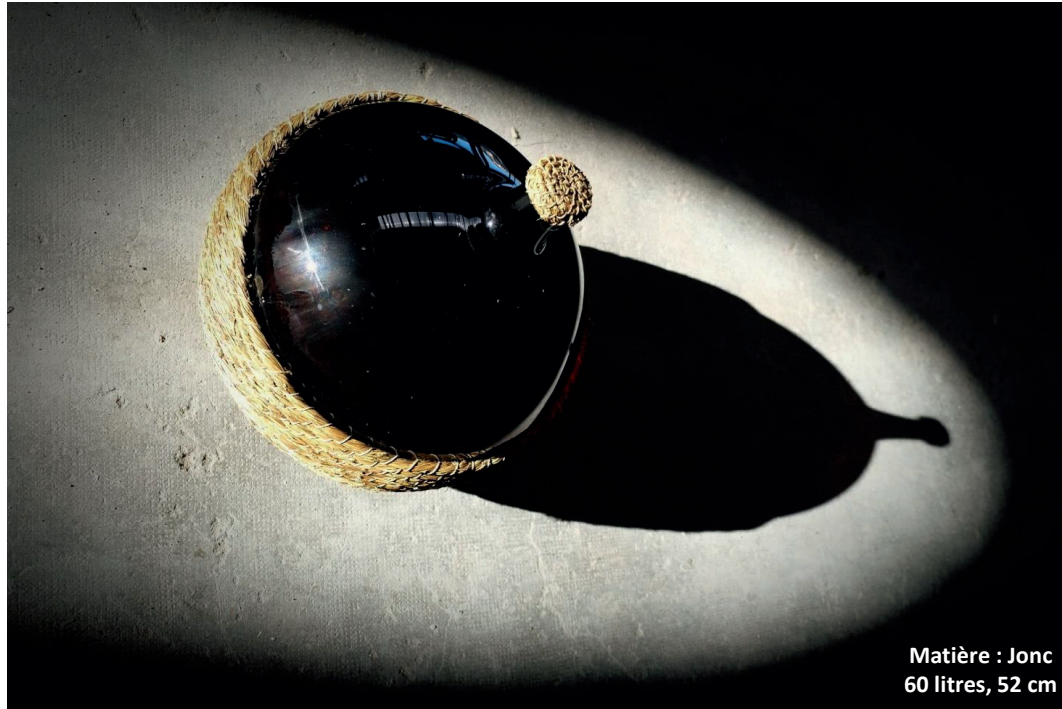
Matière : Jonc 60 litres, 52 cm