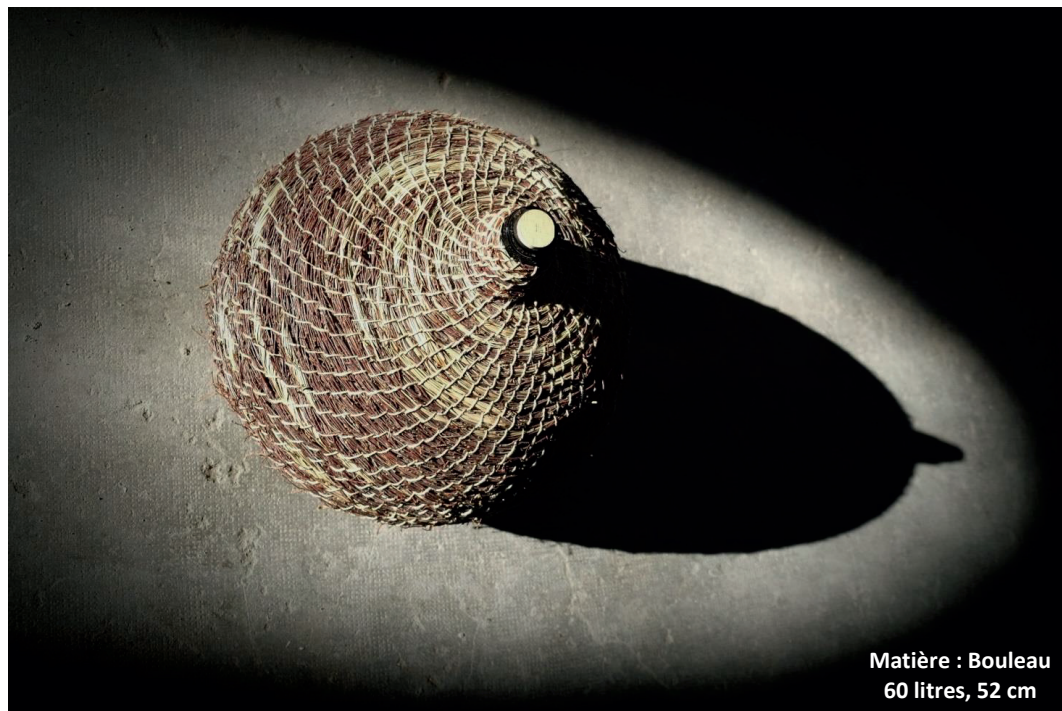
Matière : Bouleau 60 litres, 52 cm