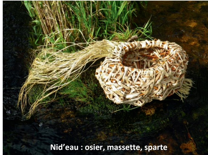
Nid'eau : osier, massette, sparte