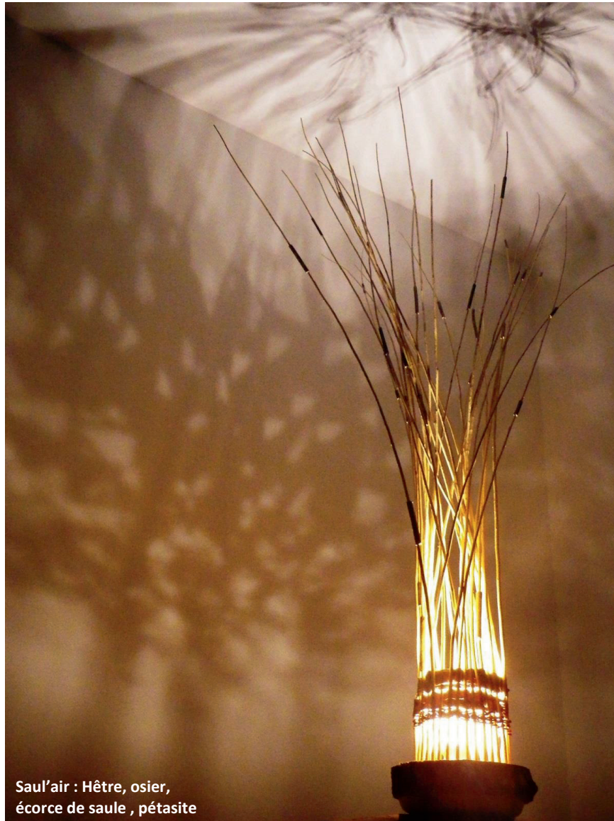
Saul'air : Hêtre, osier, écorce de saule , pétasite