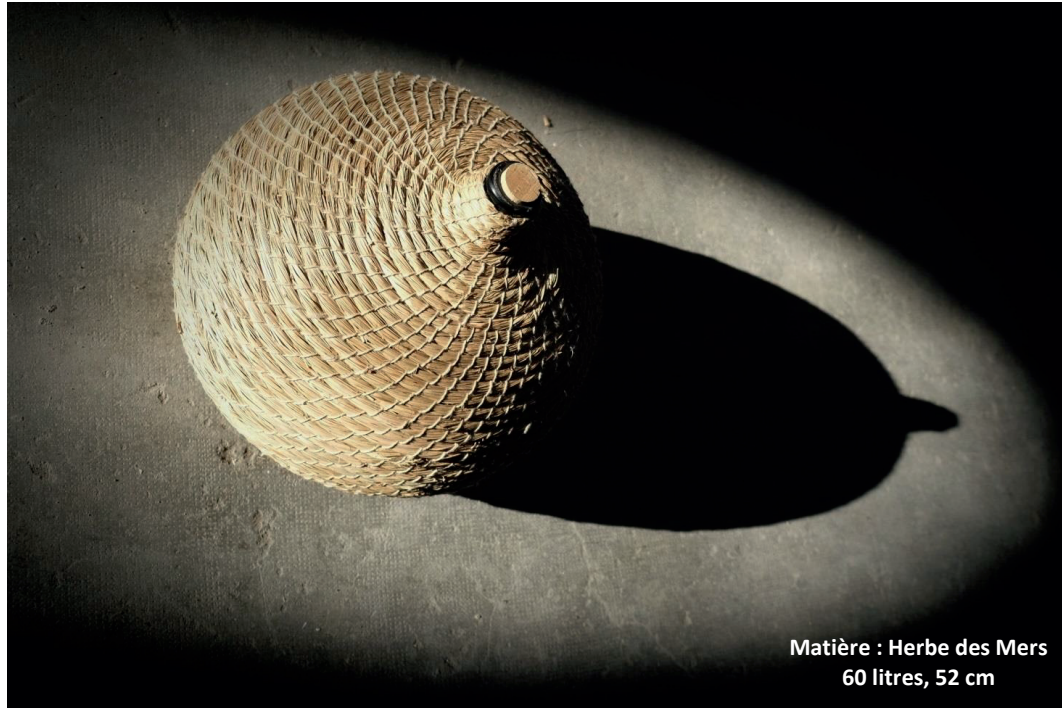
Matière : Herbe des Mers 60 litres, 52 cm