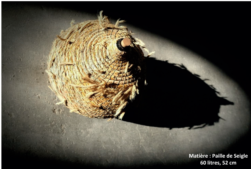
Matière : Paille de Seigle 60 litres, 52 cm