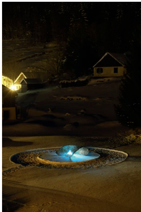
Osier, corde, neige, lumière 3,70 m x 2,80 m / Le Valtin [FR]