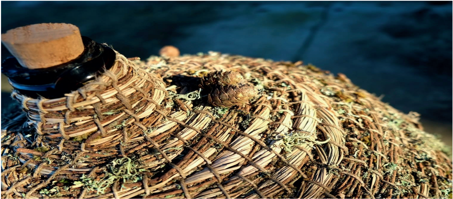
Exposition de Vannerie spiralee *