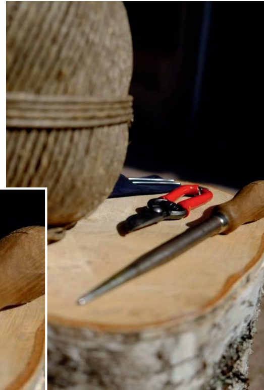
des Outils et des gestes...