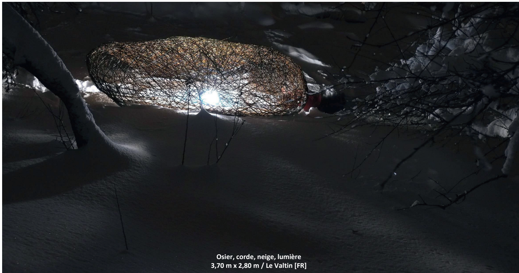
Osier, corde, neige, lumière 3,70 m x 2,80 m / Le Valtin [FR]