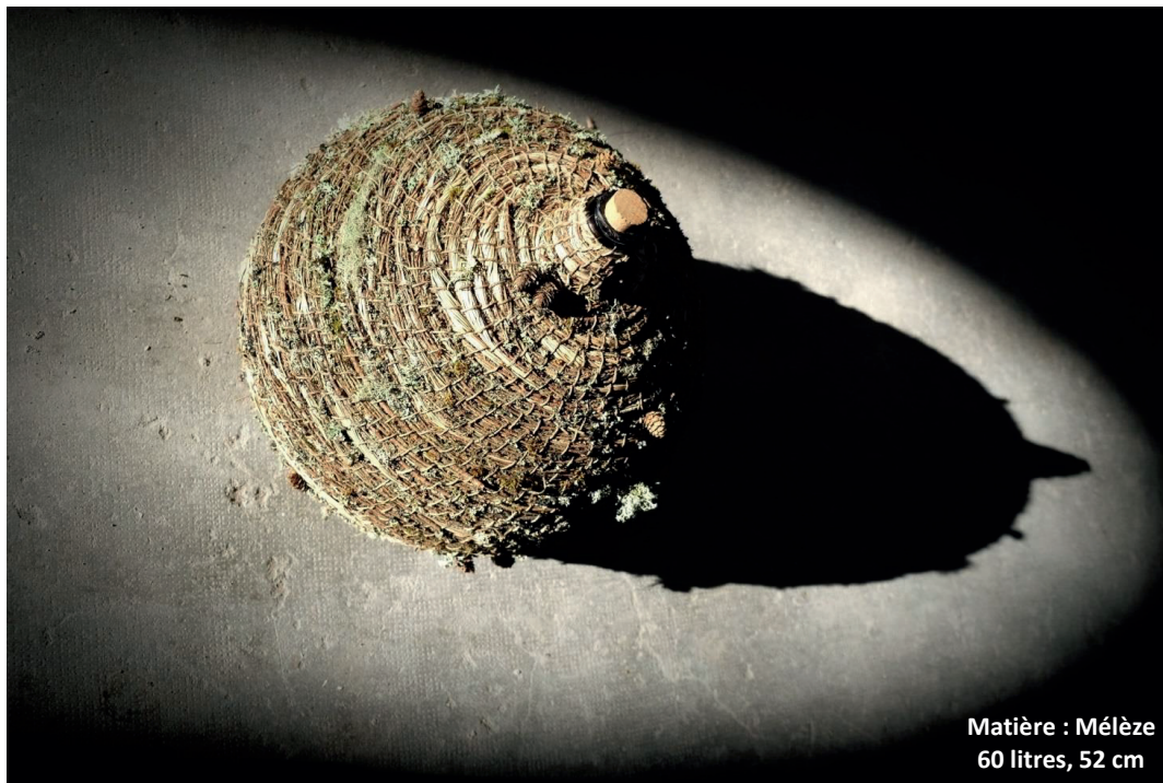
Matière : Mélèze 60 litres, 52 cm